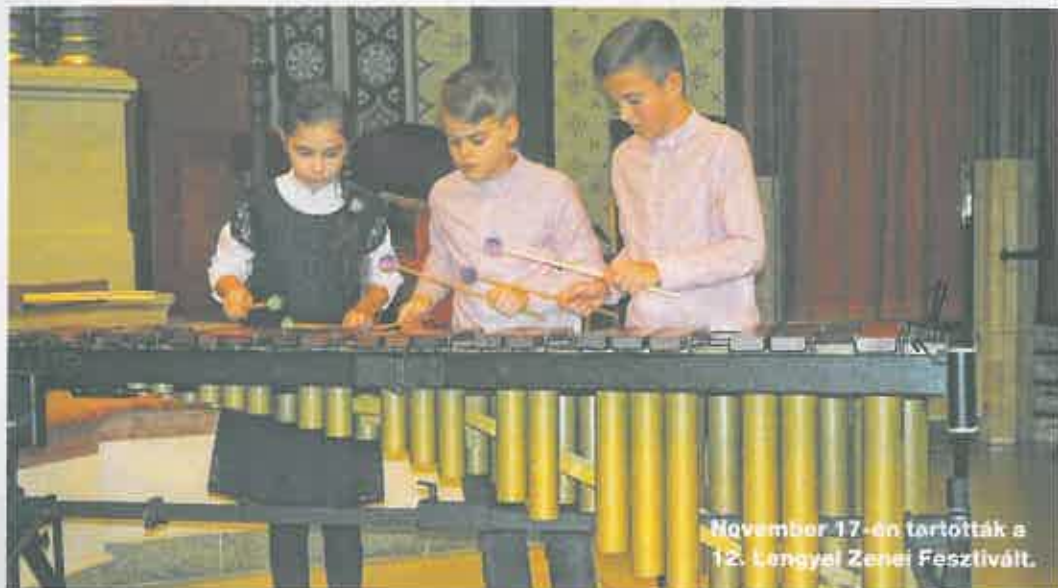
November 17-én tartották a 12. Lengyel Zenei Fesztivált.