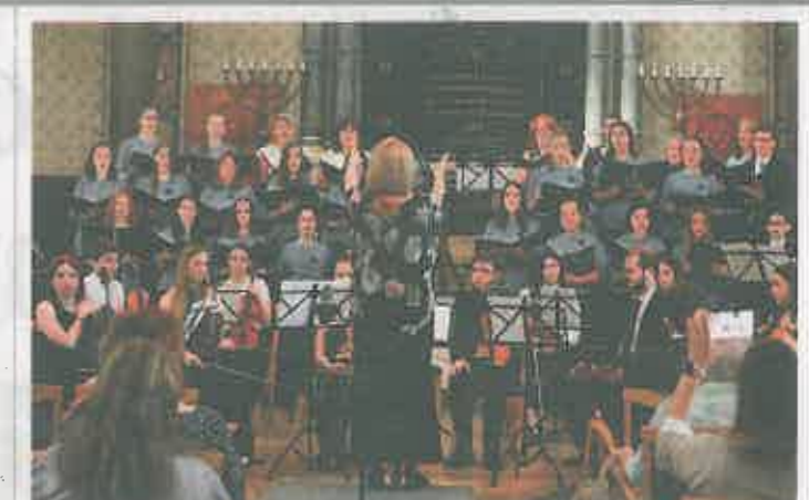
A Liszt Ferenc Zeneiskola kórusa és vonoszenekara - vezényel Popper Ágnes.