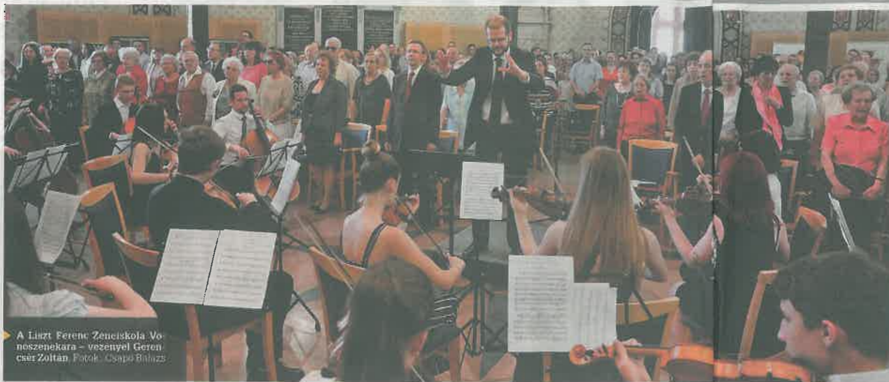
A Liszt Ferenc Zeneiskola Vonoszenekara - vezényel Gerencsár Zoltán.